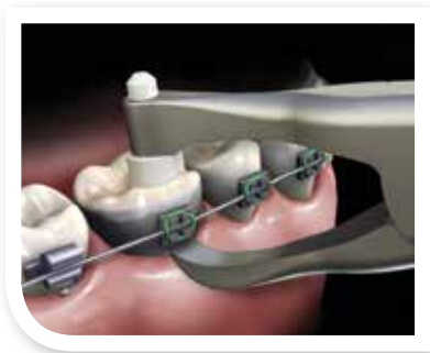
Vista bucal de la pinza de remoción de bandas