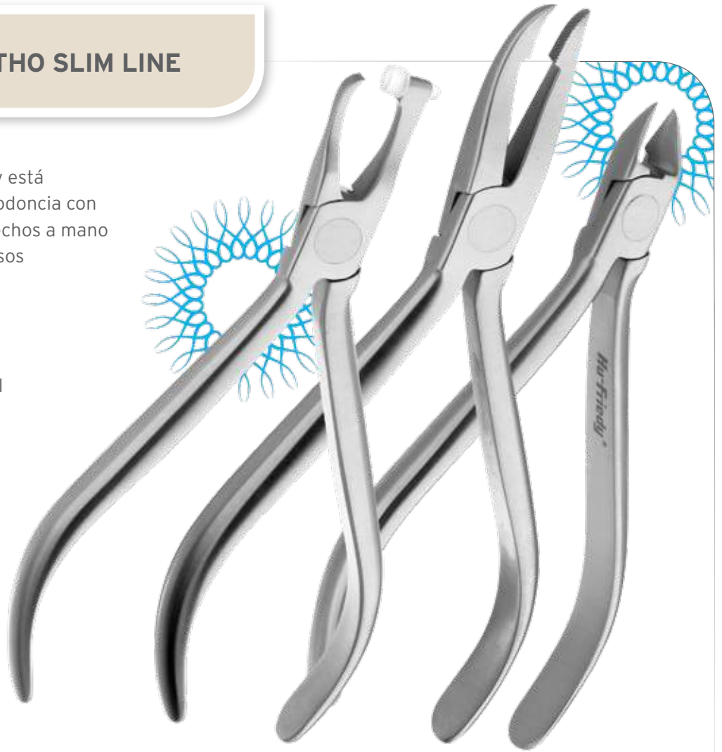
Pinzas removedoras de bandas 678-503