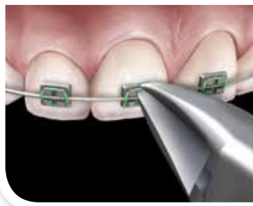
Vista facial del micro cortador delgado Para cortar un módulo elástico