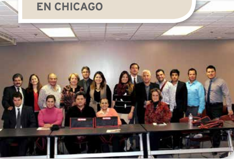
Foto del tour de la fábrica de Hu-Friedy. Vea "Hu-Friedy por la Región" para más fotos del Midwinter.

Entre muchas de las actividades de la semana del Midwinter, el equipo de Hu-Friedy de América Latina realizó un extenso tour de la fábrica donde los invitados pudieron enterarse de las últimas innovaciones y observar la producción de algunos de sus instrumentos favoritos. Durante el congreso hubo muchas sesiones educativas y Hu-Friedy aprovechó para anunciar una alianza muy interesante con la empresa suiza EMS. La semana cerró con una exitosa cena en honor a los distribuidores de la marca en Latinoamérica