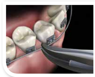
Vista facial de la pinza Weingart

Para más información del Slim Line Collection de Hu-Friedy, visite www.hu-friedy.com